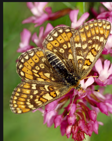
Damier de la Succise