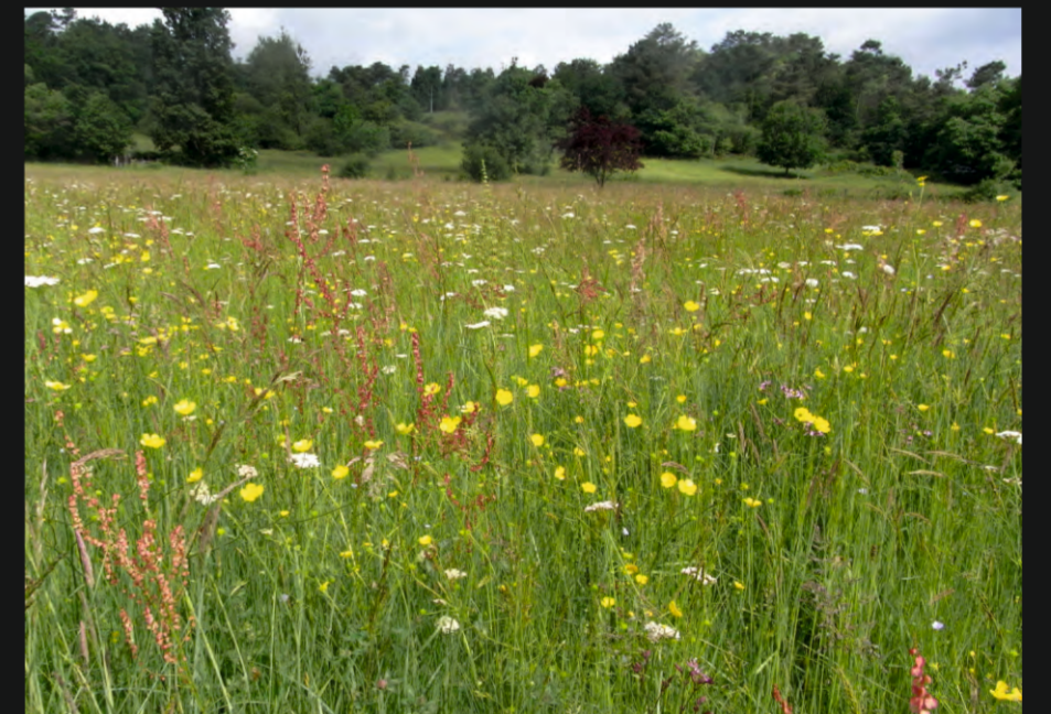
Prairie de fauche alluviale