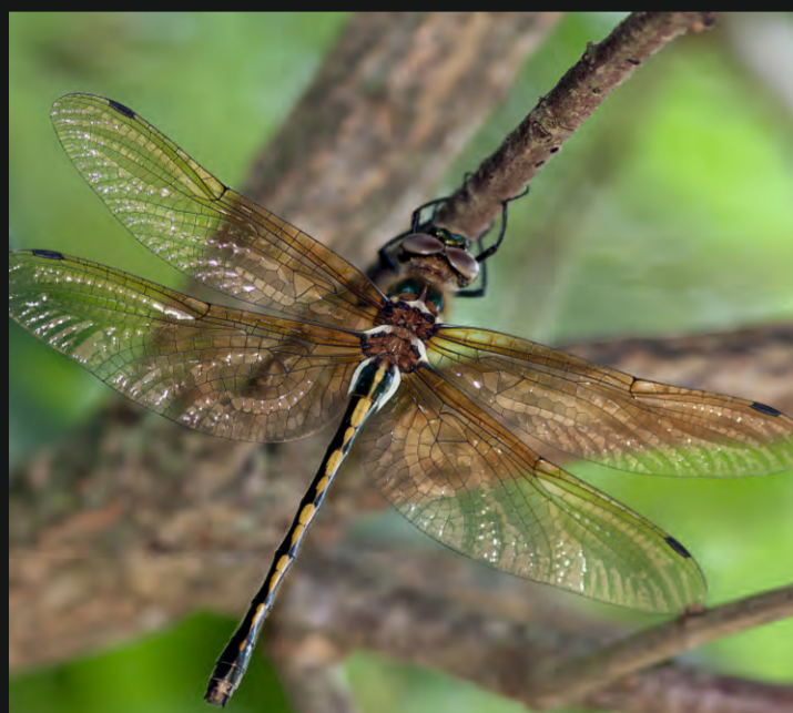
Cordule à corps fin