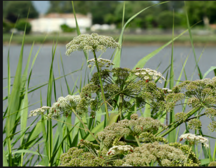
Angélique des estuaires