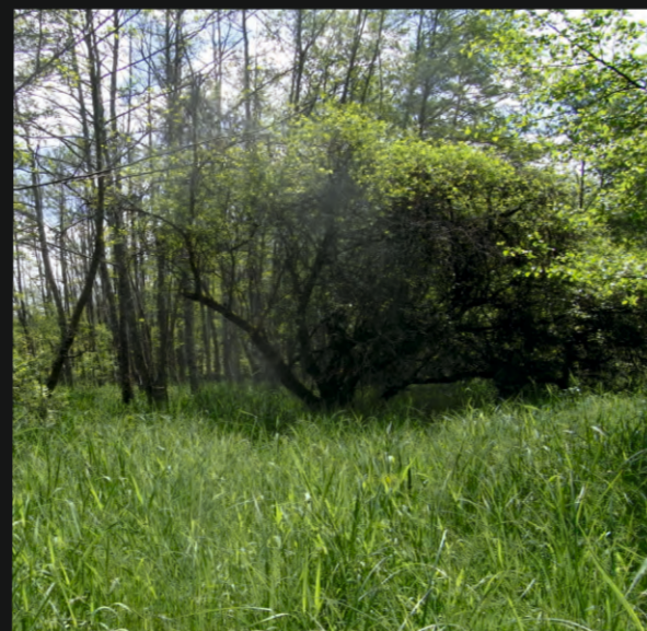
Forêt alluviale à bois tendres