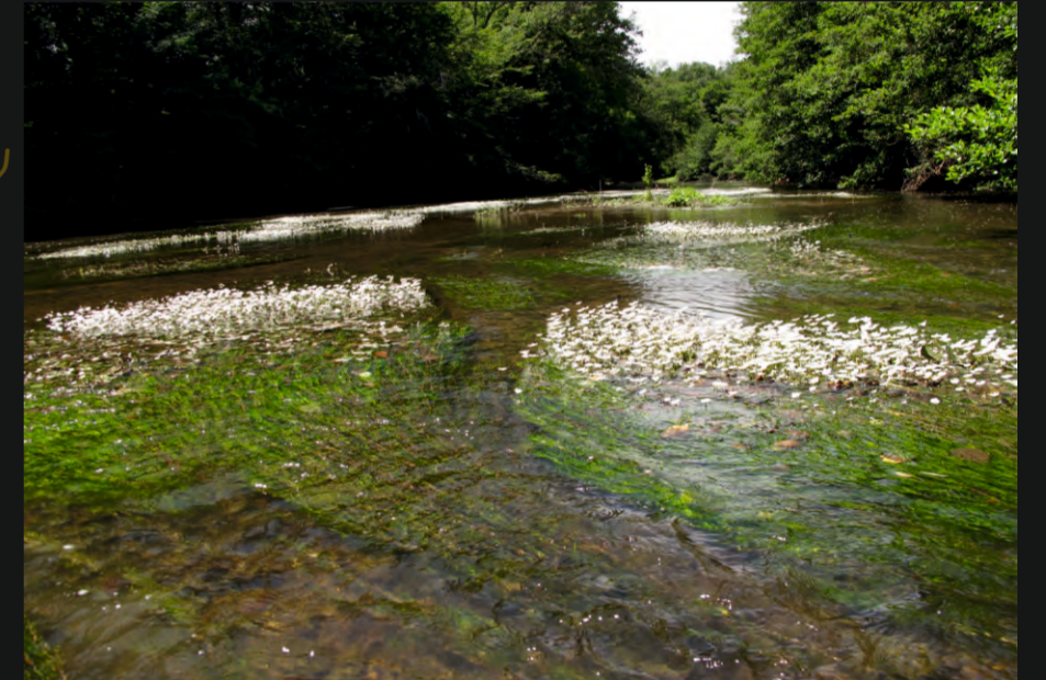
Herbier à renoncule